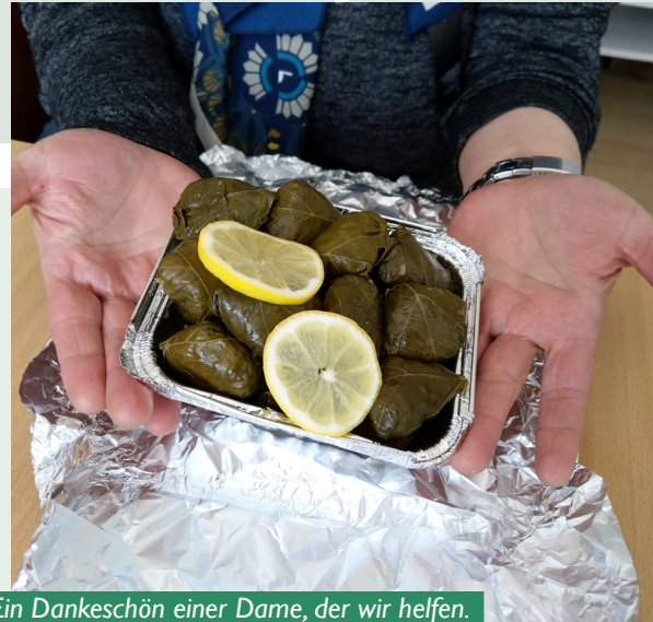
Ein Dankeschön einer Dame, der wir helfen.