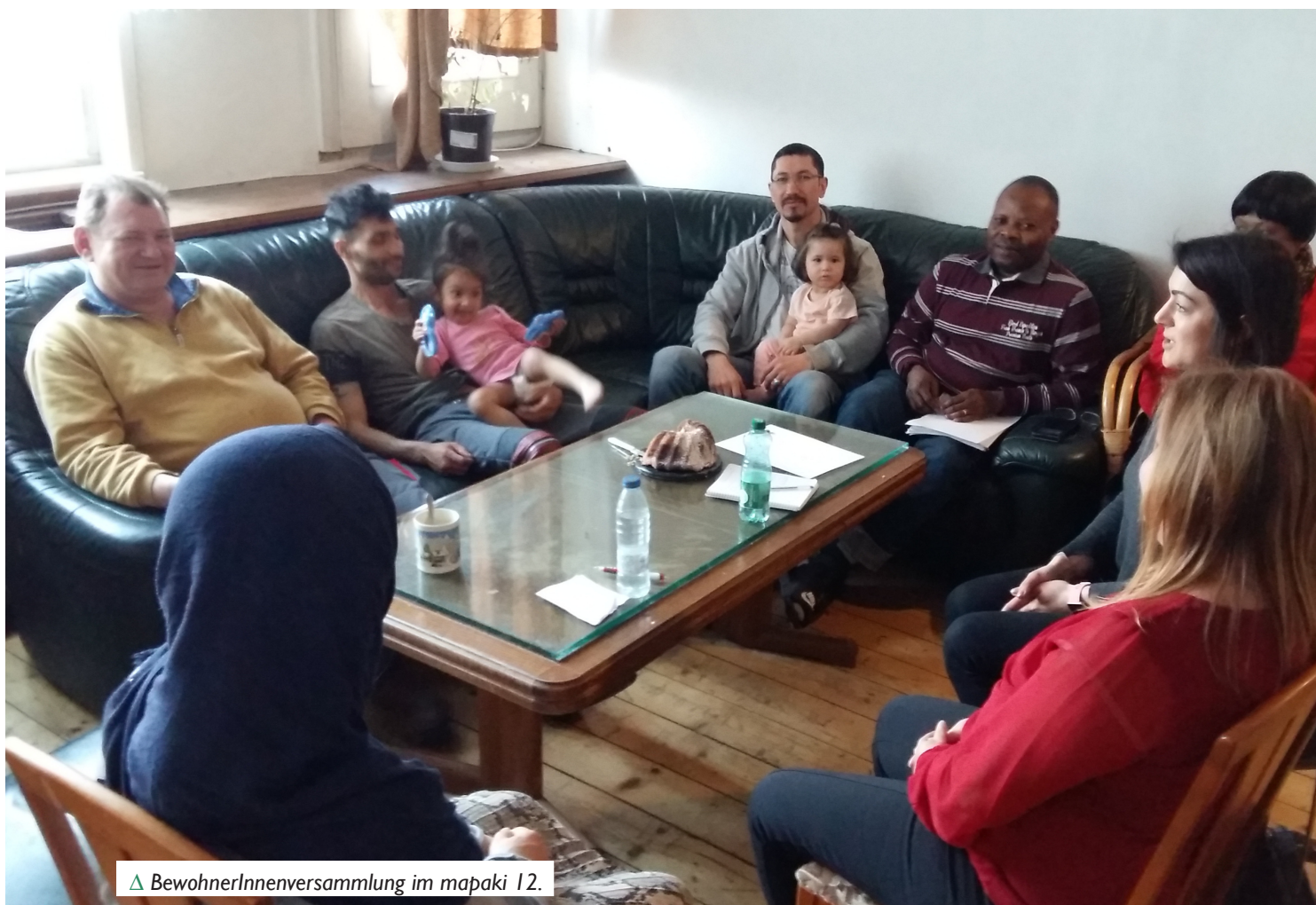
△ BewohnerInnenversammlung im mapaki 12.