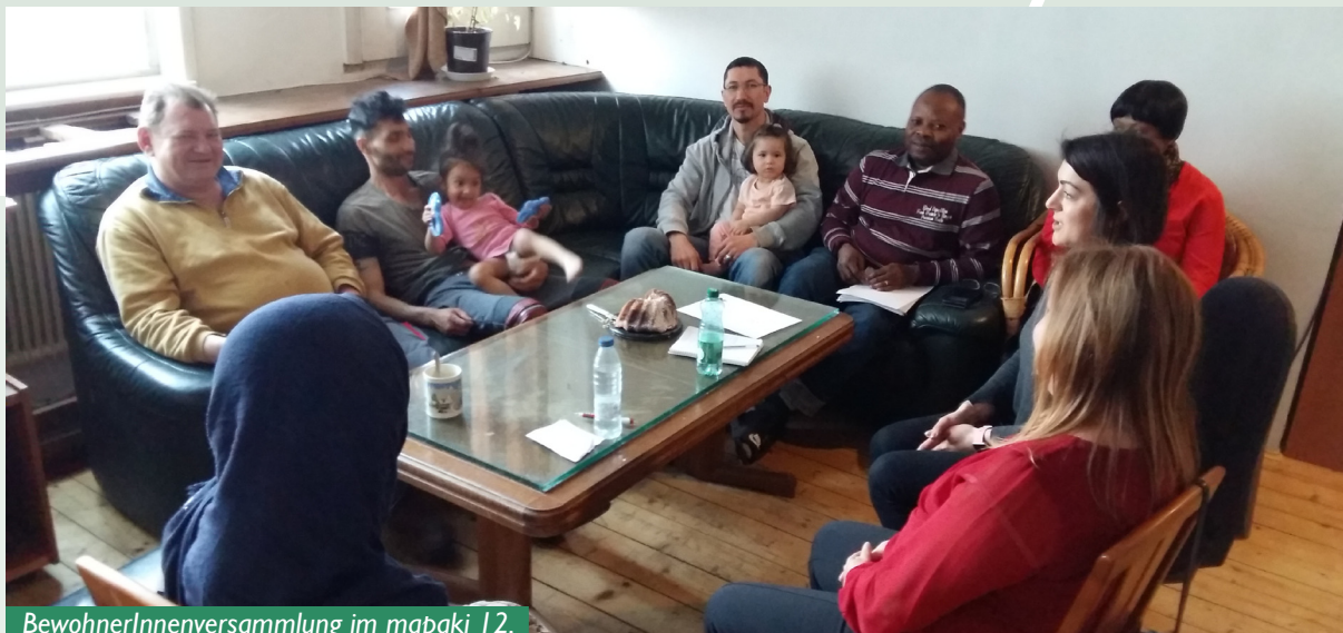
BewohnerInnenversammlung im mapaki 12.