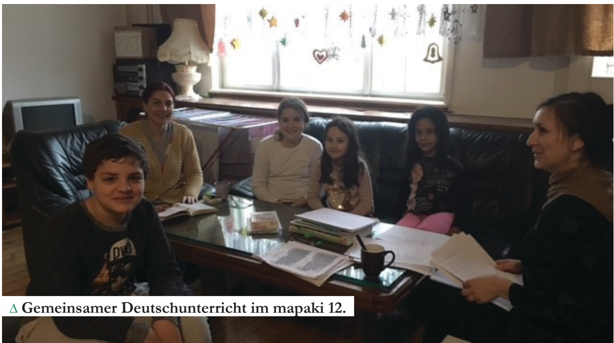
△ Gemeinsamer Deutschunterricht im mapaki 12.