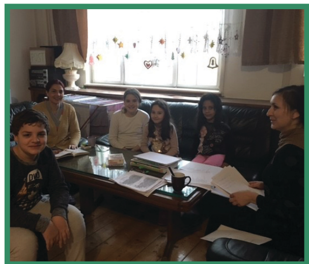
△ Gemeinsames Deutschlernen in mapaki 12.