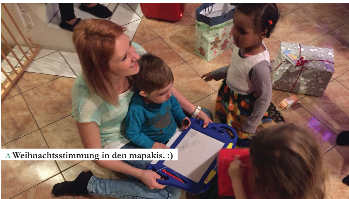
△ Weihnachtsstimmung in den mapakis. :)