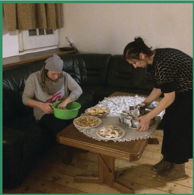
△ Die Weihnachtsfeier kann beginnen. :)