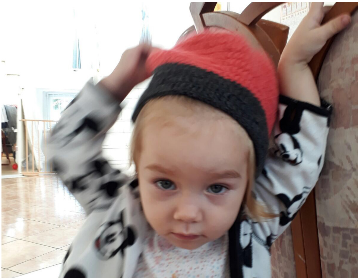
△ Der Winter kann kommen: Das MaPaKi 22 häkelt wieder.