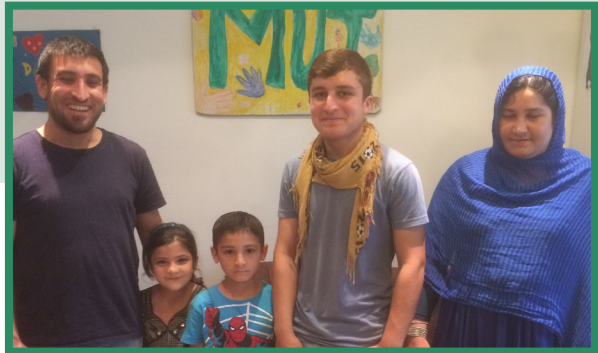
△ Sicher im MaPaKi: Familie K..