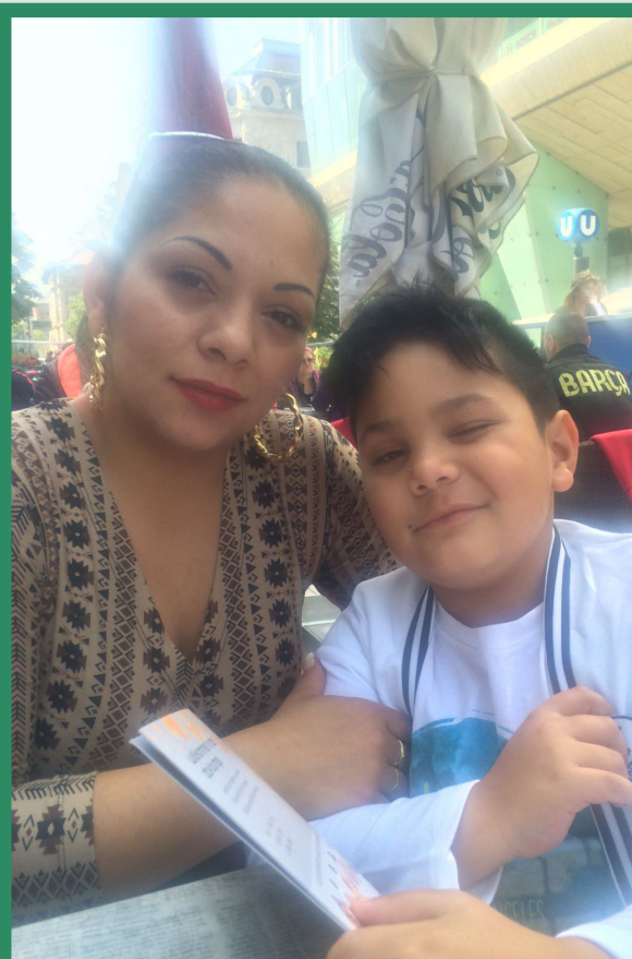
△ Wir unterstützten die Familie mit Lebensmittelgutscheinen.

Wir berieten sie über Ausbildungs- und Fördermöglichkeiten und unterstützten mit Lebensmittelgutscheinen, um den akuten Engpass aufgrund dieser unvorhergesehenen Zahlungen überwinden zu können.